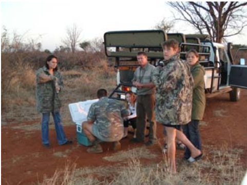
"Gamedrive med efterfølgende "Sundowner"

Efter vi havde fået installeret os og fået vasket rejsestøvet af, blev vi inviteret på en gamedrive, sammen med vores PH'er og deres familier, så vi kunne få hilst på hinanden og samtidig indskyde den riffel, jeg hjemmefra havde arrangeret at jeg skulle låne dernede.