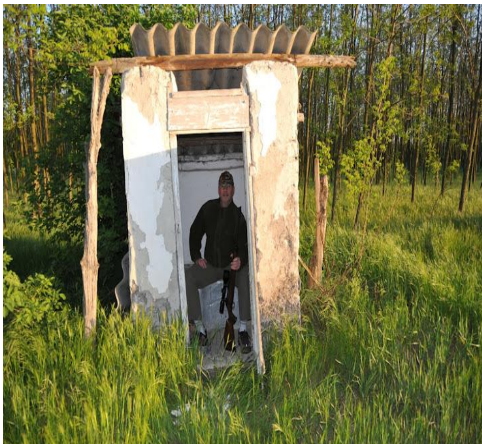
Jagthytte i Ungarn