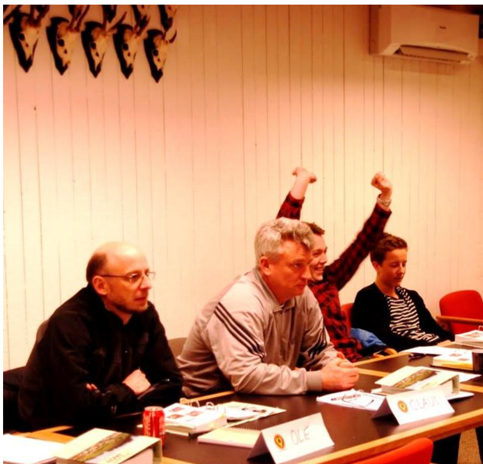
Forårets jagttegnselever i gang med vildtkending