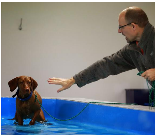
Åh far, behøver du kommandere!

Næste svømmedag er 25/1 kl. 14 – 17. Tilmelding til aschouenborg@gmail.com